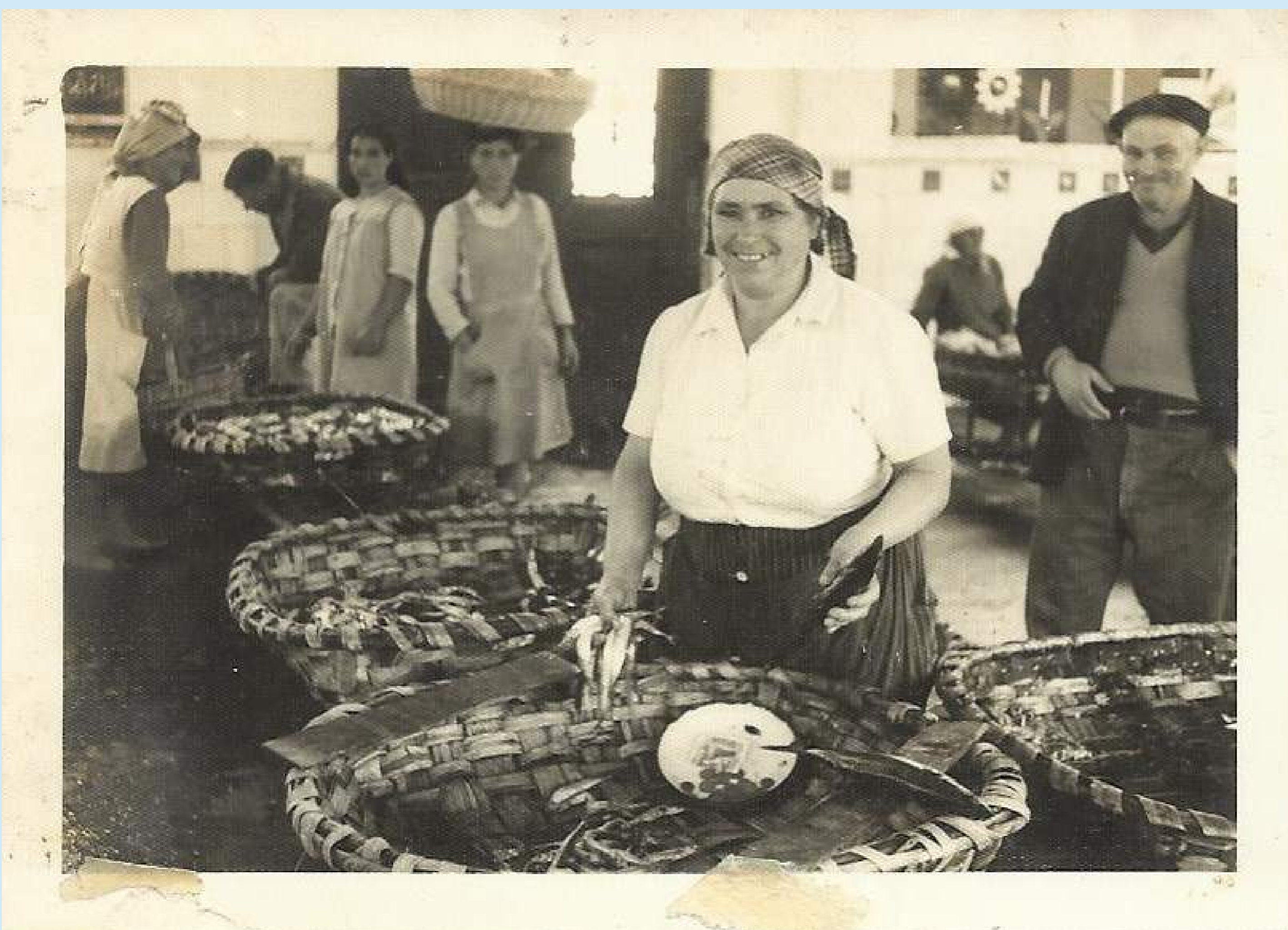
PESCANTINA VENDIENDO PESCADO.