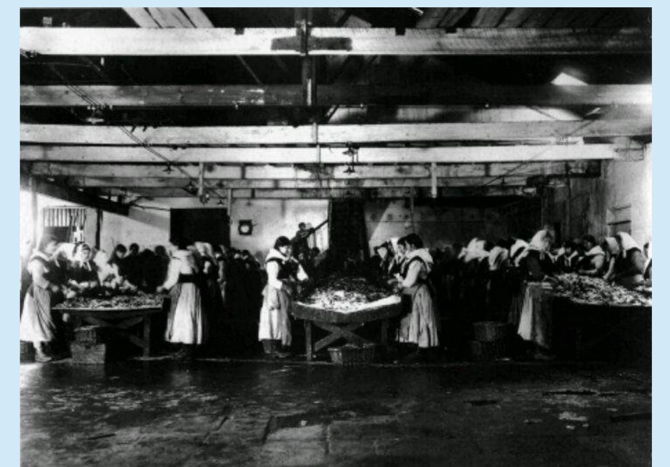
MUJERES TRABAJANDO EN LA INDUSTRIA CONSERVERA LIMPIANDO SARDINA.