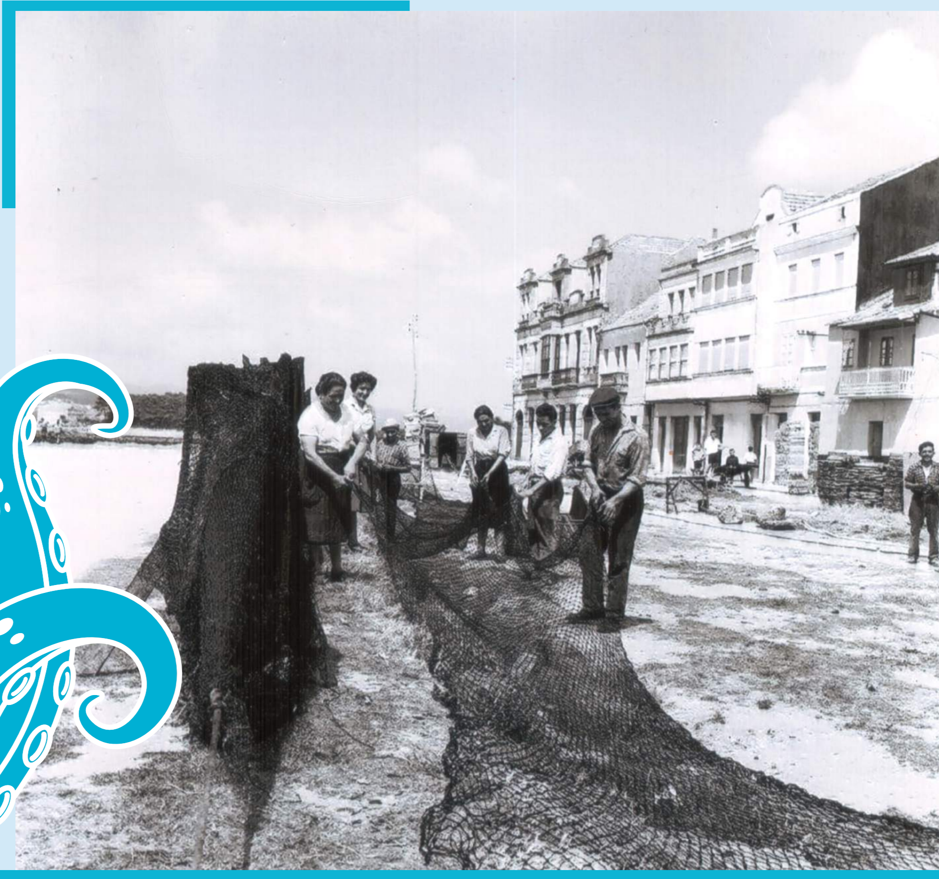
REPARANDO LA RED.