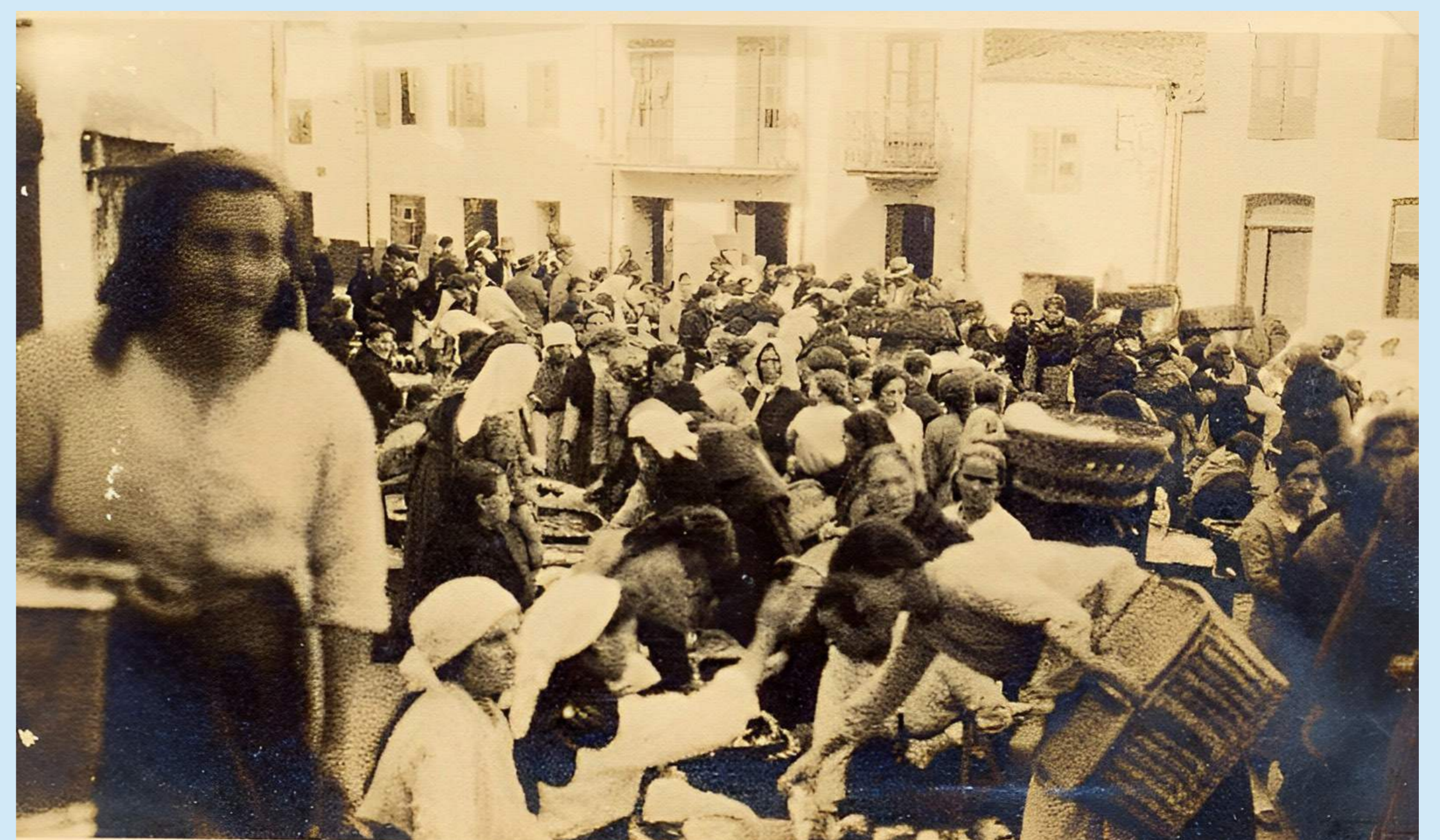
PLAZA DE PESCADO DE MARÍN. AÑO: 1920.

En aquellos tiempos la ría de Pontevedra gozaba de una fuente inagotable de riqueza destacando de entre toda la fauna marítima, la sardina. Esta especie era la más abundante lo que llevó en 1550 a recaudar 80.000 ducados a base de este pescado azul que era exportado a otras zonas como Levante, Andalucía, Sicilia, Génova y hasta a Grecia.