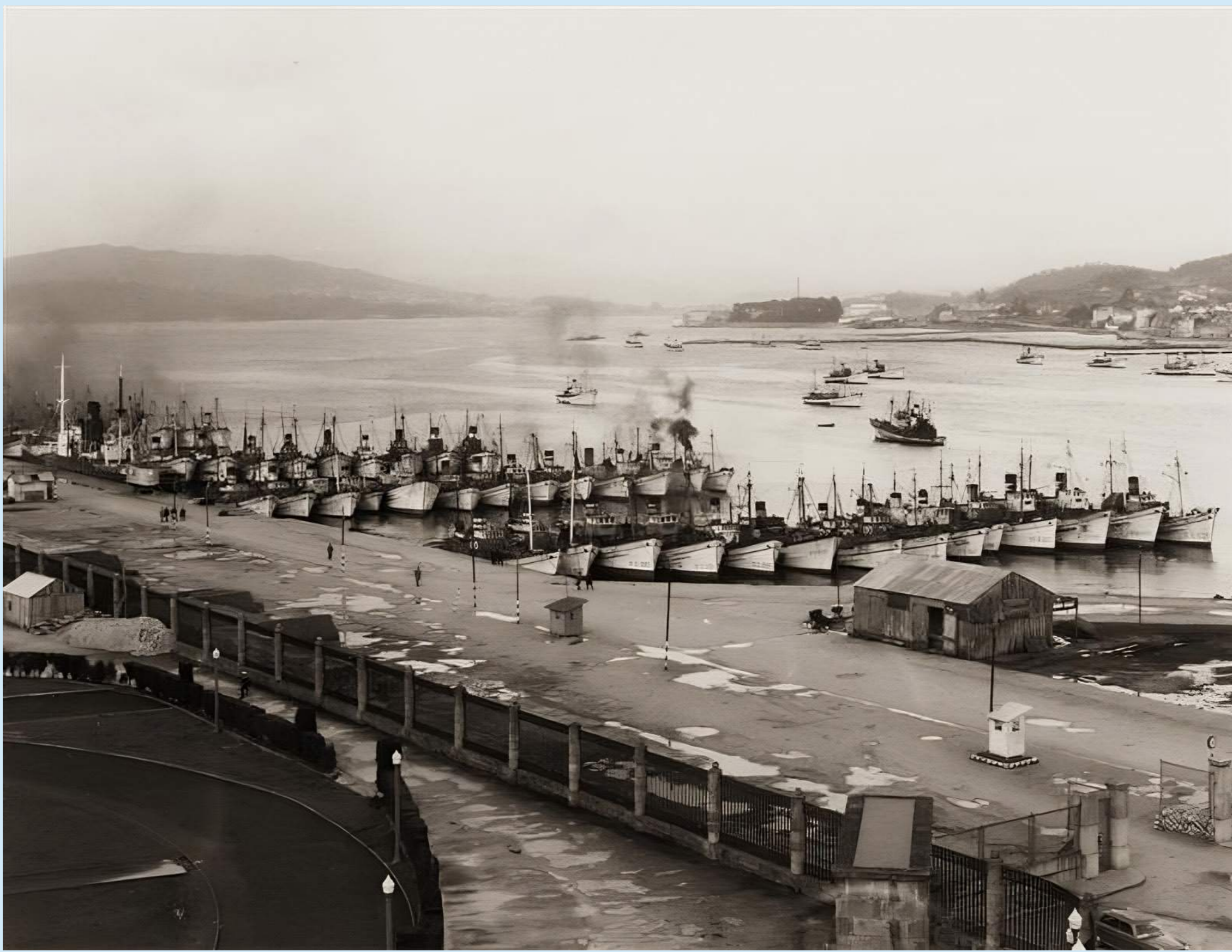
EMBARCACIONES EN EL MUELLE VIEJO DE MARÍN