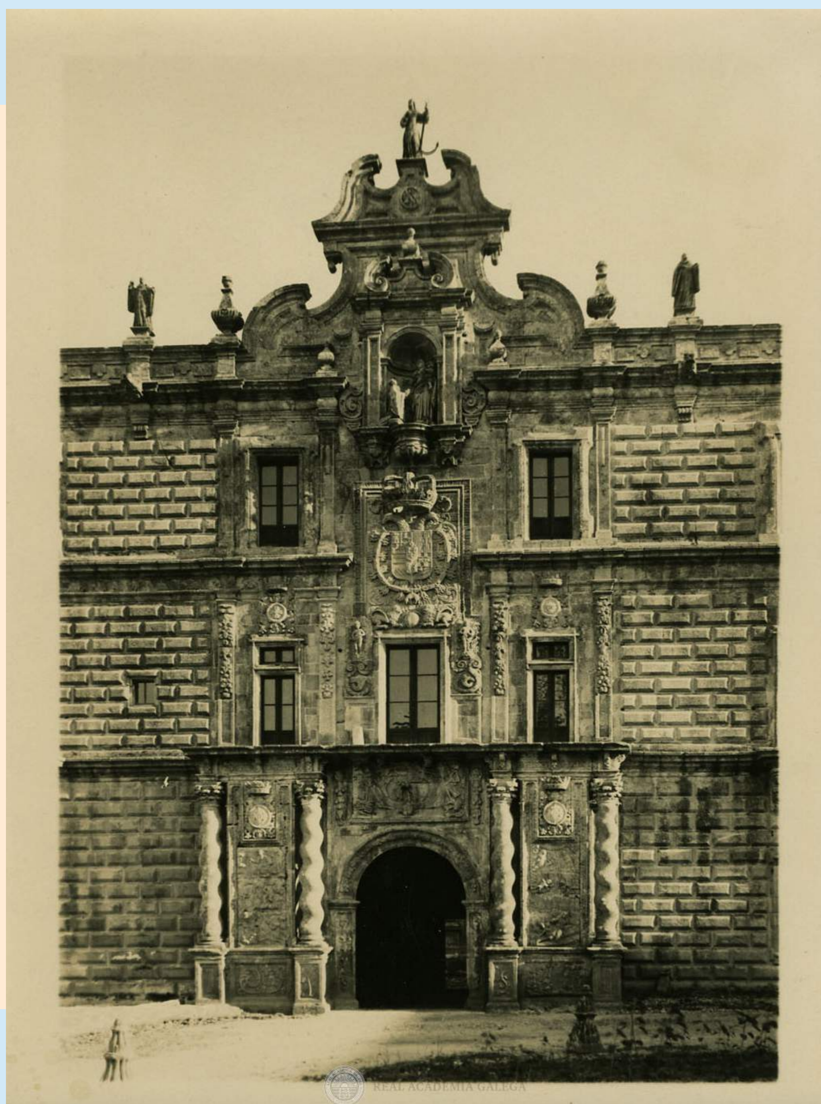
IGLESIA DEL MONASTERIO DE OSEIRA. AÑO: 1930