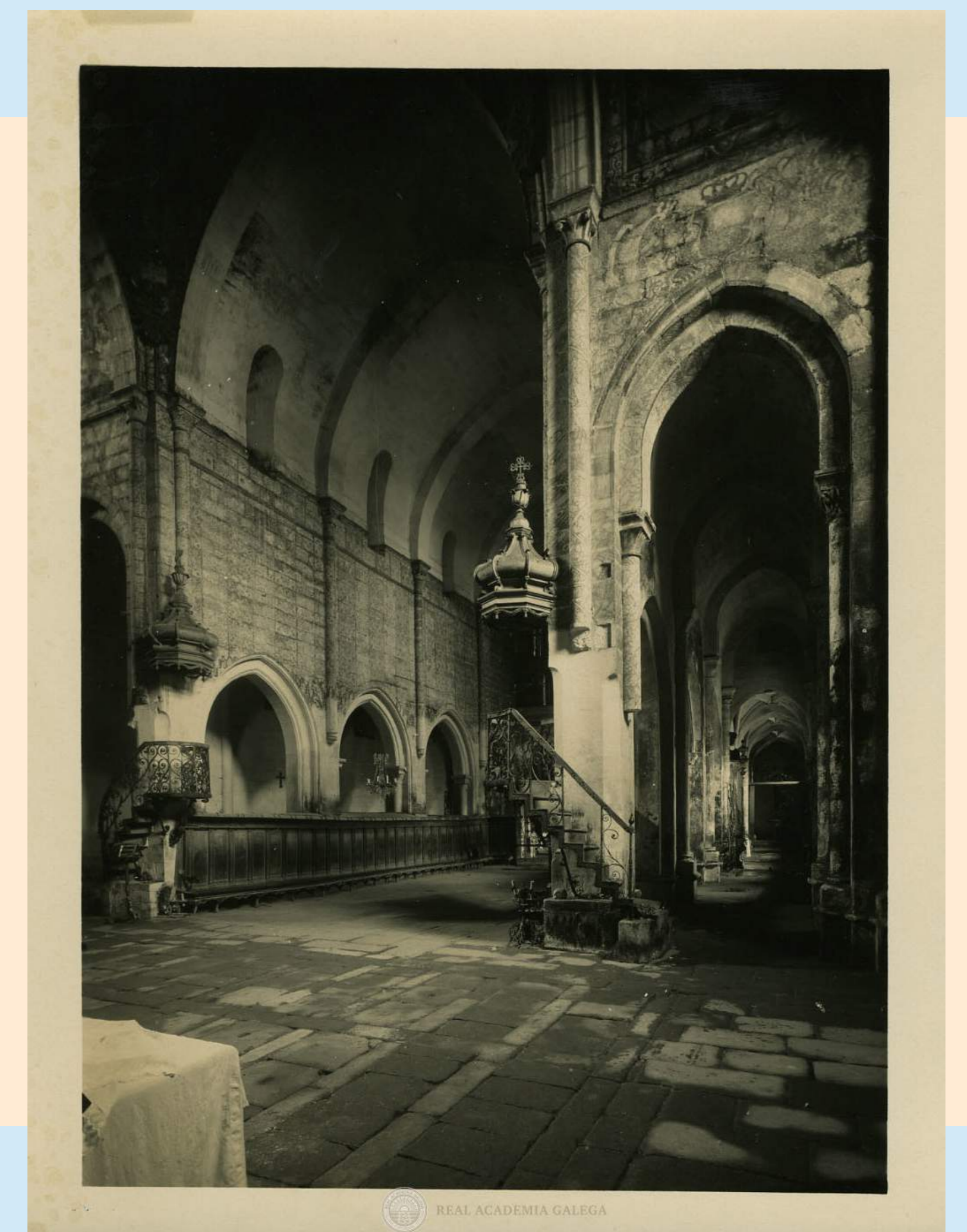
INTERIOR IGLESIA DEL MONASTERIO DE OSEIRA. AÑO: 1930