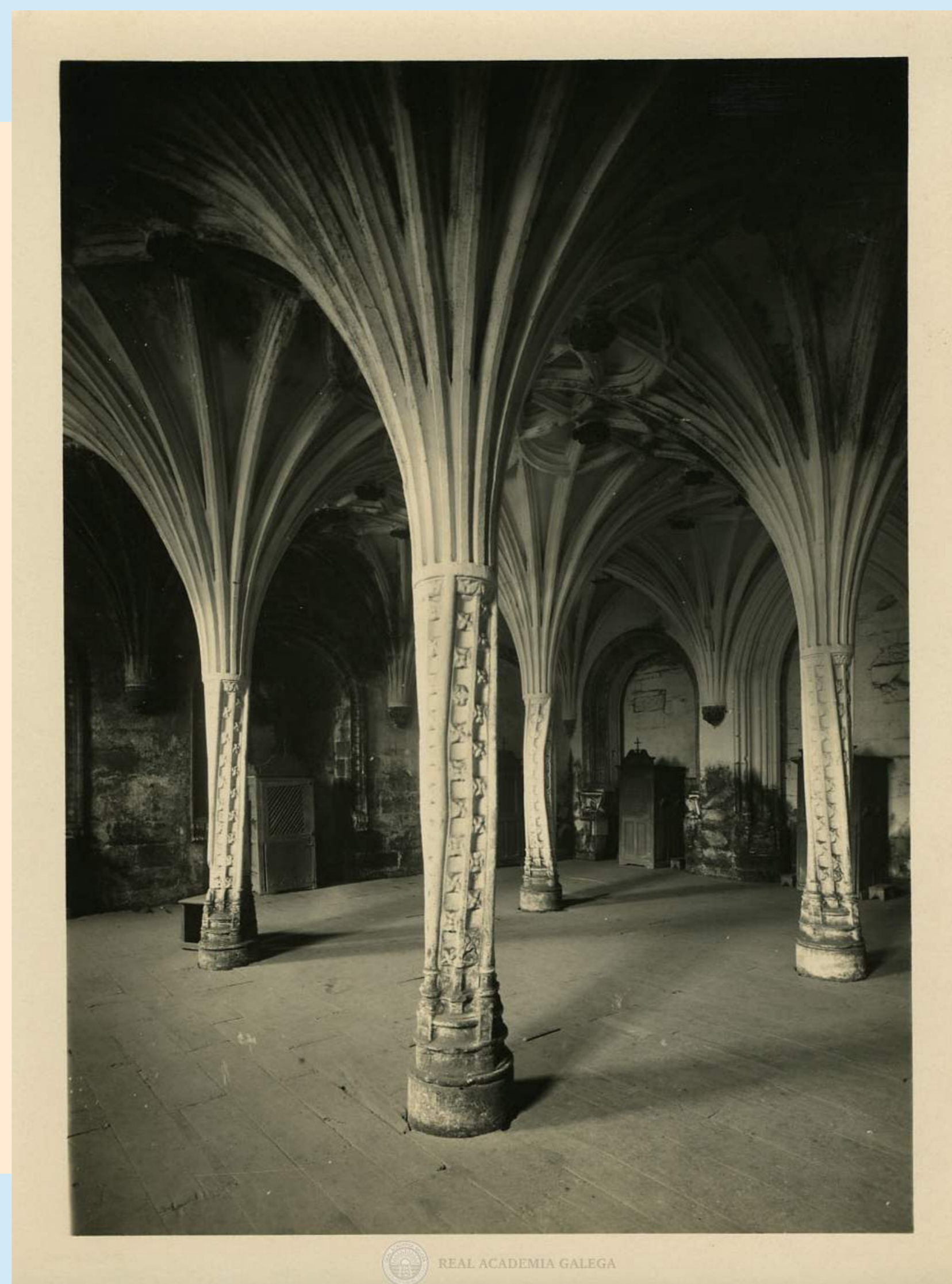
SALA DE LAS PALMERAS, MONASTERIO DE OSEIRA. AÑO: 1930