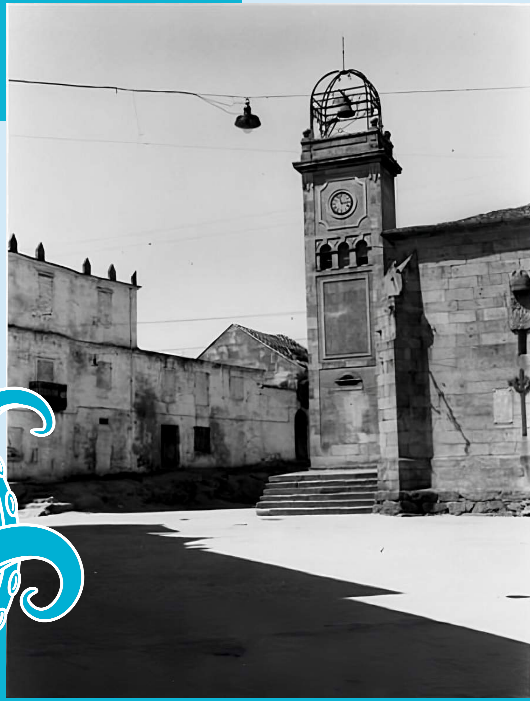
PRIORATO DE MARÍN. AÑOS 20.